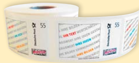
Selbstklebende Briefmarken auf einer Rolle